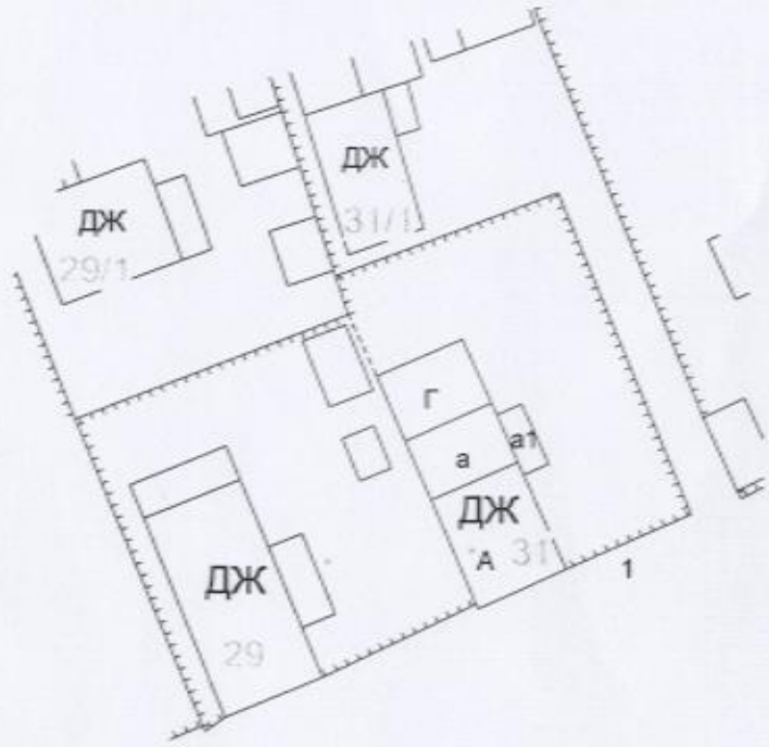
Схема планировочной организации земельного участка по адресу улица Валявкина дом 31, кадастровый номер